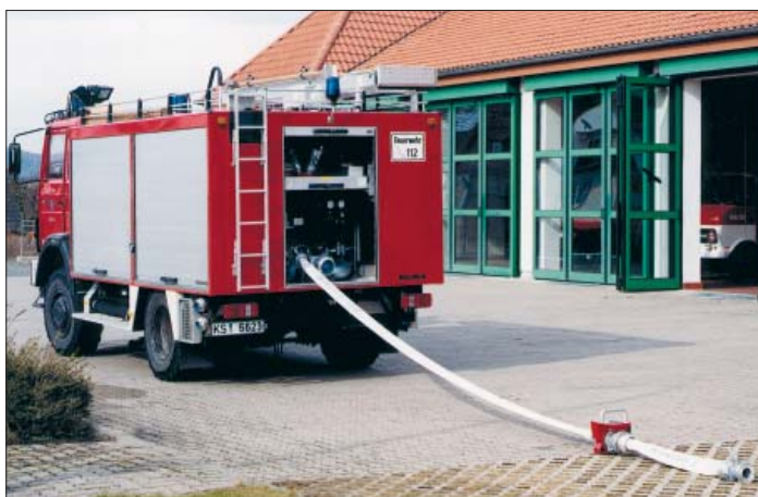
Bild 2 - 4: Messung des statischen und dynamischen Druckes sowie des Volumenstromes

Der leistungsfähige Akku erlaubt eine Arbeitsdauer von bis zu 6 Stunden.