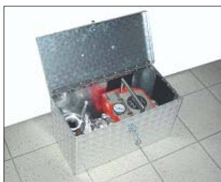
Bild 5: Transportkoffer mit Innenausstattung für Flowmaster und Düsensatz.

Abmessungen: 360 mm hoch 555 mm breit 290 mm tief Gewicht: 6 kg Art.-Nr. 187222